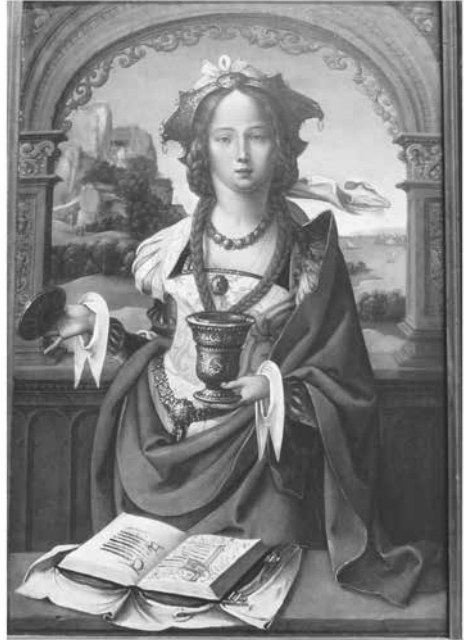
Maria Magdalena, frühes 16. Jh.

Am 22. Juli feiert die Kirche Maria Magdalena – die Frau, die Jesus grenzenlos geliebt hat. Sie blieb nach dem Zeugnis des Johannes noch unter dem Kreuz bei ihm. Und sie war die Erste, die ihn als Auferstandenen erlebt hat. Eine Frau, die bis heute fasziniert. Das zeigt zum Beispiel auch der Kinofilm „Maria Magdalena“, der im Frühjahr in den Kinos lief.